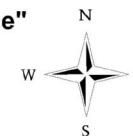
Карта градостроительного зонирования пос. Кубановка М 1: 10 000