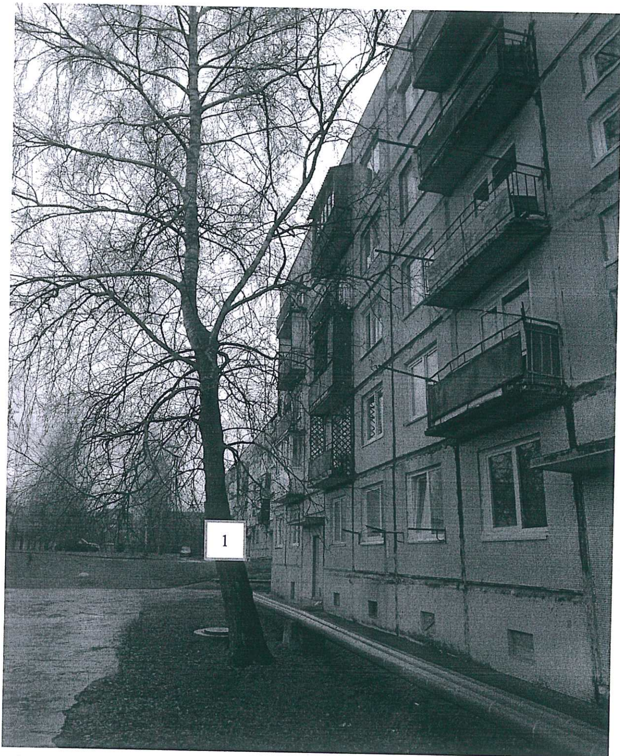
Фото-таблица (подеревная съёмка) зеленых насаждений. Калининградская область, г. Гусев, проспект Ленина, д.3Б, придомовая территория