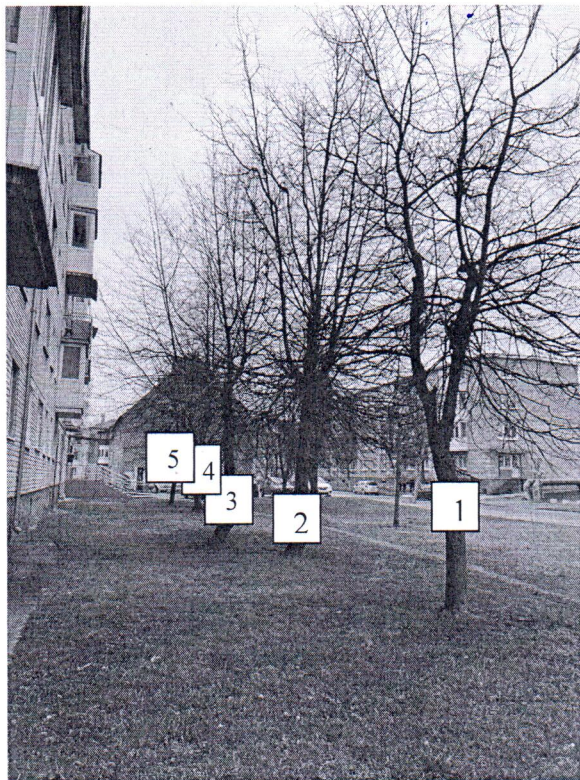
Фото-таблица (подеревная съёмка) зеленых насаждений по адресу: Калининградская обл., г. Гусев, территория ул. Ульяновых, д. 26.