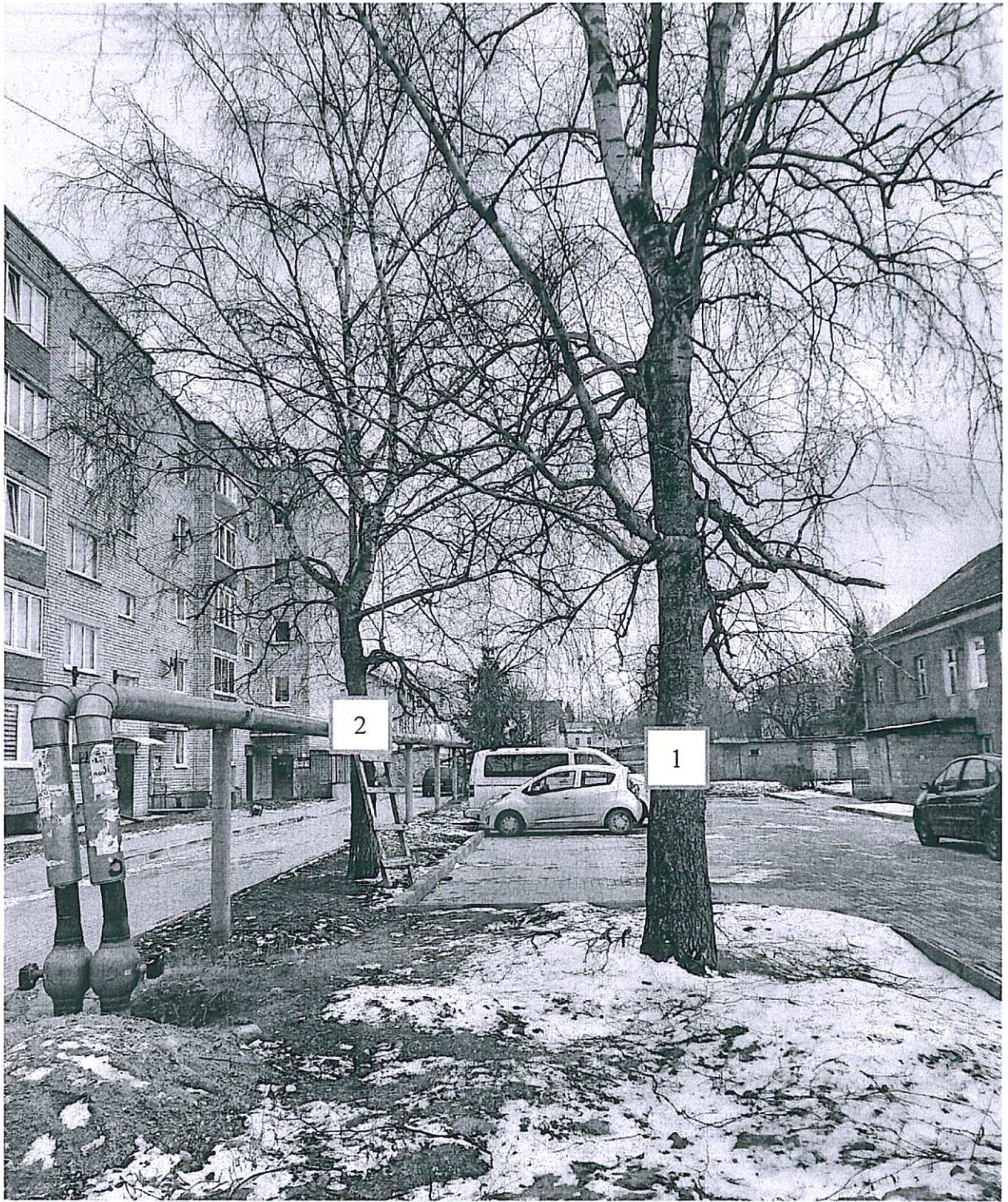
Фото-таблица (подеревная съёмка) зеленых насаждений. Калининградская область, г. Гусев, ул. З.Космодемьянской, д.8 Придомовая территория

Съемку проводил и.о. начальника отдела строительства и эксплуатации управления ЖКХ и коммунальной инфраструктуры