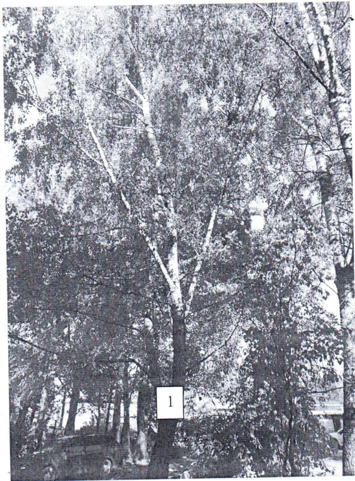
Фото-таблица (подеревная съёмка) зеленых насаждений по адресу: Калининградская обл., г. Гусев, ул. 3. Космодемьянской, д.13