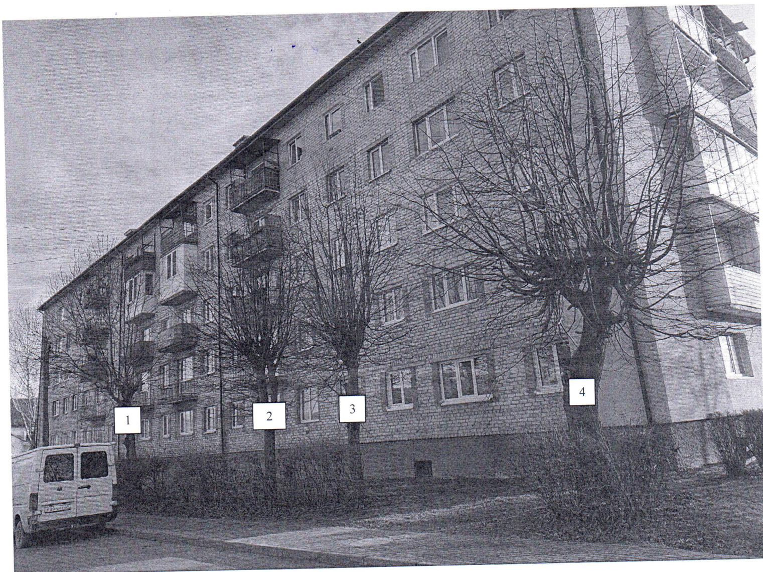
Фото-таблица (подеревная съёмка) зеленых насаждений по адресу: Калининградская обл., г. Гусев, ул. Советская, д.13

Съемку проводил ведущий специалист отдела эксплуатации и содержания объектов благоустройства