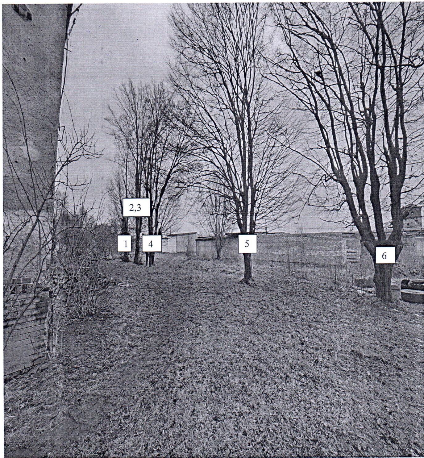
Фото-таблица (подеревная съёмка) зеленых насаждений по адресу: Калининградская обл., г. Гусев, ул. Советская, д.19а

Съемку проводил и.о. начальника отдела строительства и эксплуатации управления ЖКХ и коммунальной инфраструктуры