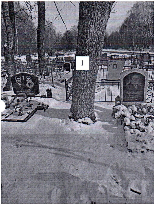
Фото-таблица (подеревная съёмка) зеленых насаждений по адресу: Калининградская обл., Гусевский район, пос. Покровское, кладбище ЗУ с КН 39:04:370005:251