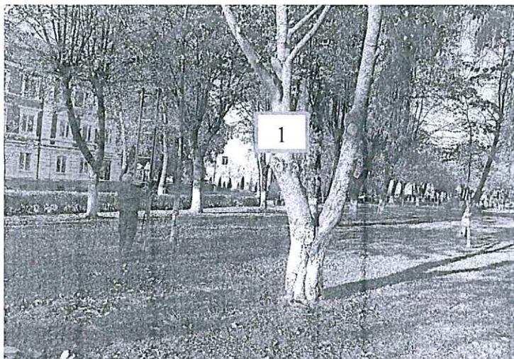
Фото-таблица (подеревная съёмка) зеленых насаждений. Калининградская область, г. Гусев, ул. Ульяновых, сквер.