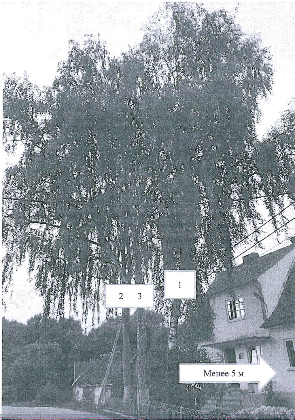
Фото-таблица (подеревная съёмка) зеленых насаждений. Калининградская обл., Гусевский район, п. Липово, ул. Набережная, территория дома № 3.

Специалист I - категории отдела строительства и эксплуатации управления ЖКХ и коммунальной инфраструктуры