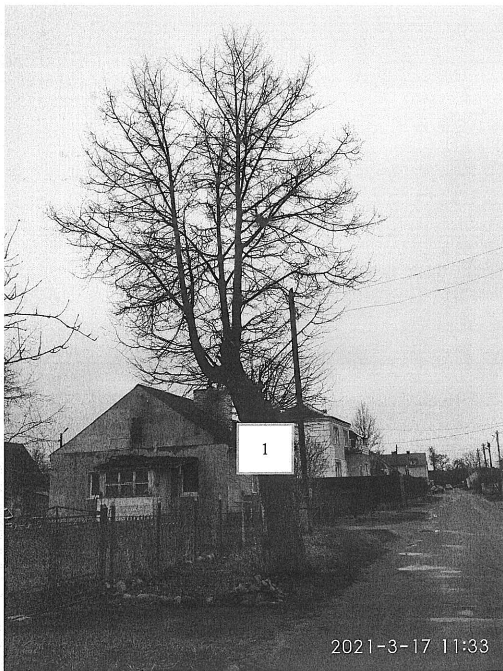
Фото-таблица (подеревная съёмка) зеленых насаждений. Калининградская обл., г. Гусев, ул. А. Невского, около дома № 12.