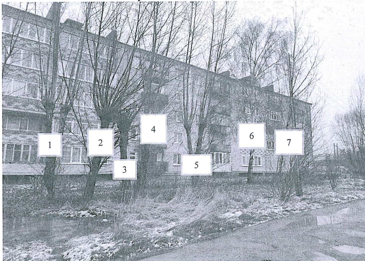
Фото-таблица (подеревная съёмка) зеленых насаждений. Калининградская обл., г. Гусев, ул. Менделеева, 2А