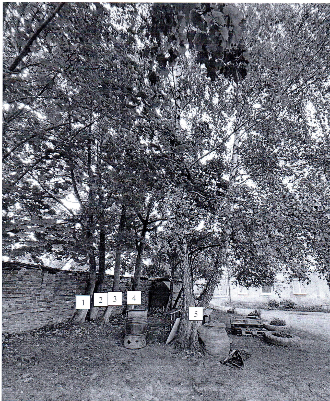
Фото-таблица (подеревная съёмка) зеленых насаждений по адресу: Калининградская обл., г. Гусев, ул. Школьная, д.13, на придомовой территории