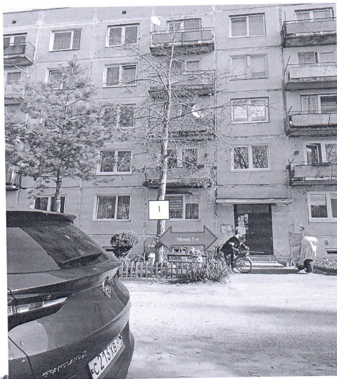
Фото-таблица (подеревная съёмка) зеленых насаждений по адресу: Калининградская обл., г. Гусев, пр. Ленина, 3Б, КН 39:04:010136:909

Съемку проводил ведущий специалист отдела эксплуатации и содержания объектов благоустройства